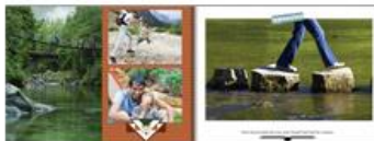
De natuur in!